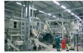
Plantas completas de pelletizado