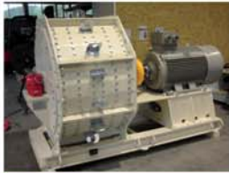
Molinos para madera húmeda y seca, diferentes trasiegos especiales para madera y pellets de madera