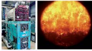
Plantas de Biomasa, energía térmica y eléctrica