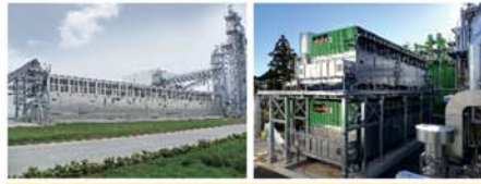
Secadores de banda de baja temperatura