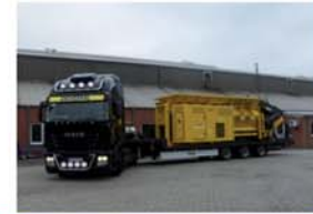
Pre-trituradores, trituradores, Refinadores para madera y voluminosos